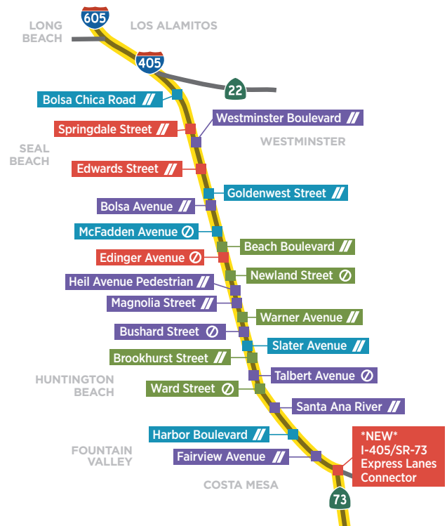
Bridge Map as of 3/9/18